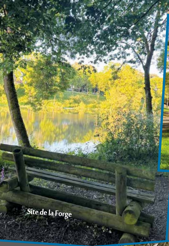
Site de la Forge