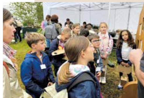
Atelier Horticulture – CE1 et CE2 Foire de Béré en septembre 2024