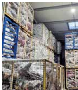
Entrepôt très plein au Relais Atlantique

Depuis de nombreuses années, le RELAIS ATLANTIQUE, émanation du groupe EMMAÛS, reçoit chaque année, des chaussures usagées collectées par les milliers de bénévoles à l'entrée du printemps. Le RELAIS ATLANTIQUE a la charge de revendre ces tonnes de chaussures usagées. La somme d'argent collectée est reversée à ASSOCIATION ONCO PLEIN AIR afin qu'elle puisse organiser un séjour d'été d'une semaine pour une trentaine d'enfants et d'adolescents malades du cancer et suivis au CHU de Nantes ou au CHU d'Angers : 23 016€ en 2024!