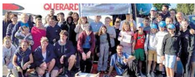
Les jeunes adhérents de l'AOPA lors du départ en Haute Savoie en août dernier.

Cette collecte n'aura donc pas lieu en mars prochain !