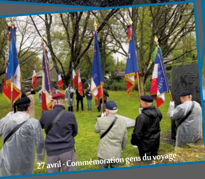
27 avril - Commémoration gens du voyage