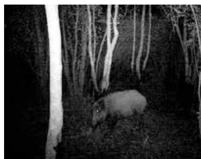
Photo nocturne prise par un de nos appareils automatique

Trop de dégâts dans les cultures, des nuisances dans le bourg, les opérations de régulation des corvidés au printemps (désolé pour le bruit) ont permis l'élimination de nombreux oiseaux.