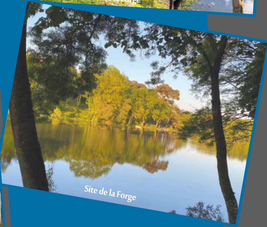
Site de la Forge