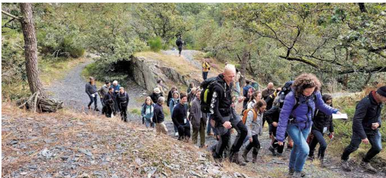
Visite du site le 10/09/2024 avec le groupe des jardins botaniques