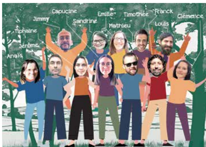
Le bureau de l'APEA

Nous vous invitons à nous suivre ou nous écrire :