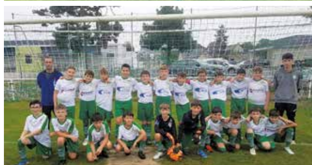
Quelques-unes de nos équipes jeunes avec les nouveaux maillots